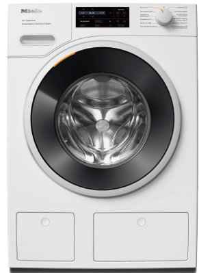
Lave-linge assorti : WSJ 800-83 CH