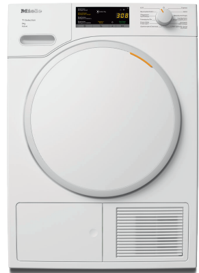
Lave-linge assorti : WSA 100-23 CH