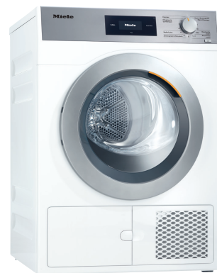
Lave-linge assorti : PWM 300-08 CH